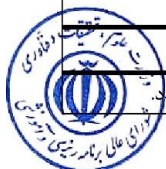
جدول دروس عمومی - اختیاری

** درس «تاریخ فرهنگ و تمدن اسلام و ایران» به تعداد ۲ واحد می‌تواند در زیرمجموعه موضوع «تاریخ و تمدن اسلامی» ارائه گردد.